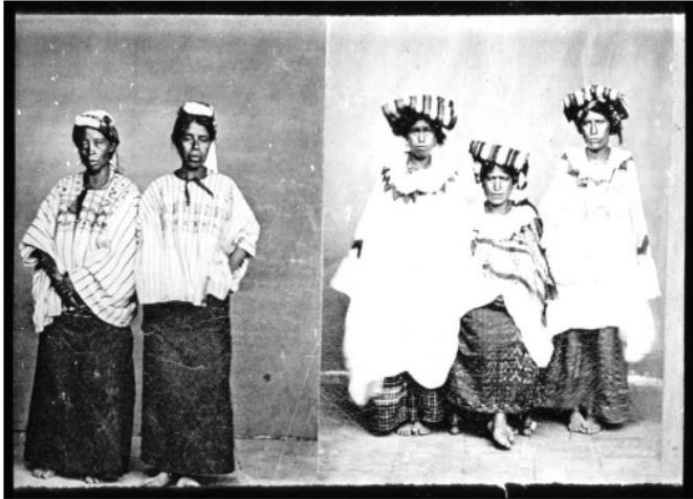
Amérique centrale. 25. Indiennes de Guatemala / [mission] P. Levy ; [photogr. ?] ; [photogr. ?]. reprod. par Molléni pour la conférence donnée par] P. Levy

Paul Levy. Indiennes de Guatemala . 1883. Bibliothèque Nationale de France