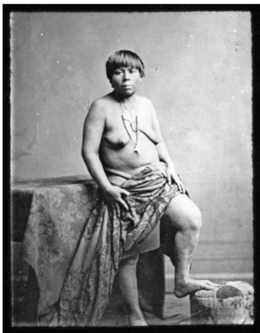
Amérique centrale. 43. Indienne sauvage. Costarica / [mission] P. Levy ; [photogr ?] ; [photogr. reprod. par Molténi pour la conférence donnée par] P. Levy

Paul Levy. Indienne sauvage . 1883. Bibliothèque Nationale de France