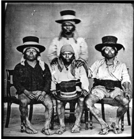
Amérique centrale. 27. Indiens de Guatemala / [mission] P. Levy ; [photogr. ?]. [photogr. reprod. par Molléri pour la conférence donnée par] P. Levy

Paul Levy. Indiens de Guatemala . 1883. Bibliothèque Nationale de France