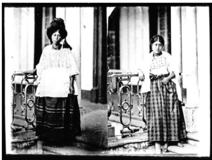
América central. 26, sirvientas indias. Guatemala / [misión] P. Levy; [fotogr. ?]; [Fotogr. Reprod. por Molténi para la conferencia pronunciada por] P. Levy

Paul Levy. Domestiques indienne . 1883. Bibliothèque Nationale de France